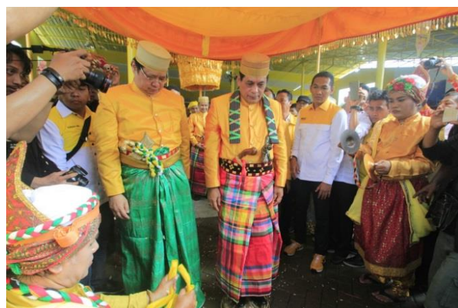
Ketua Umum Partai Golkar, Airlangga Hartarto mendampingi Nurdin Halid saat mendaftar ke KPUD Sulsel untuk ikut bertarung dalam Pilkada 2018, 8 Januari 2018.

Nurdin Halid melihat kehidupan kampung-kampung di Sulsel saat ini masih belum beranjak dari kehidupan 30-40 tahun lalu sehingga harus dibenahi secara mendasar: masyarakat kampung harus diberdayakan memanfaatkan potensi sumber daya alam dan sumber daya sosial budaya yang mereka miliki. Masyarakat di kampung-kampung harus dikuatkan dalam memproduksi dan diberi akses modal dan pasar. Itulah gagasan dasar dan komitmen perjuangan NH-Aziz yang dikenal dengan “Gerakan Membangun Kampung” . Sebuah ajakan NH-Aziz bagi masyarakat Sulsel untuk ikut berpartisipasi dalam membangun Sulsel sehingga berujung pada kemakmuran dan kesejahteraan masyarakat Sulsel.